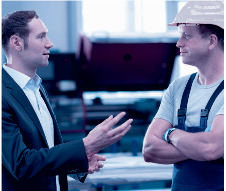
Das Mitarbeitergespräch ist keine Nebensache. Nehmen Sie sich Zeit und hören Sie zu.

Sinnvollerweise wird für das Mitarbeitergespräch zudem ein über die Jahre gleichbleibender Beurteilungsbogen mit einer Bewertungsskala (mit Smileys, Ampeln, Zahlen oder Buchstaben) verwendet.